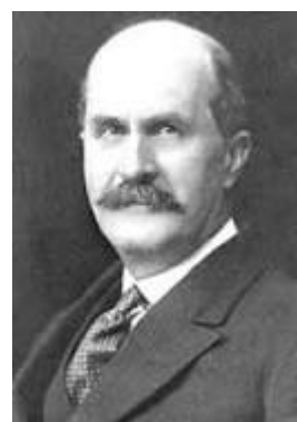
Sir W. H. Bragg

elektromagnetno zračenje koje je kasnije po njemu dobilo ime, te za to otkriće dobio i Nobelovu nagradu za fiziku 1901., Max von Laue je 1912. otkrio da rendgenske zrake difraktiraju na kristalima, te da su prostorni smjerovi i intenziteti tako difraktiranih snopova izravno povezani s unutarnjom strukturom kristala, odnosno trodimenzionalnim rasporedom atoma i molekula u kristalu. Za svoje otkriće Max von Laue je dobio Nobelovu nagradu za fiziku 1914. Sir William Henry Bragg i sir William