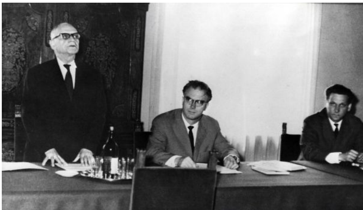
Utemeljenje Jugoslavenskog Centra za kristalografiju 29. siječnja 1966.